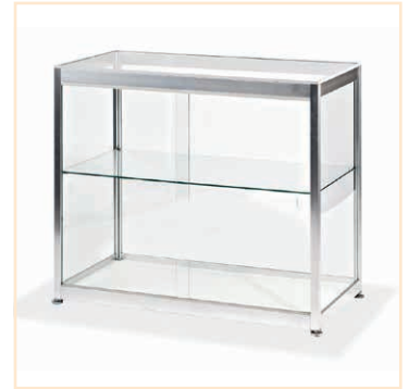
Tischvitrine vollverglast 100 x 51 x 91 cm, EUR 198,-

Bitte beachten Sie, dass die Nutzung eigener Möbel nicht gestattet ist.