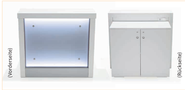
Counter ADONE (Vorderseite) weiß, beleuchtet, EUR 380,-