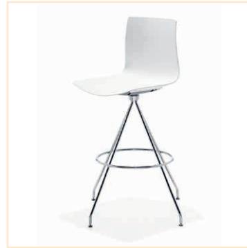
Hocker CATIFA weiß, EUR 56,-