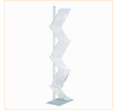
Prospektständer, ZickZack 42 x 154 x 30 cm, EUR 119,-