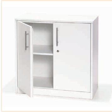
Aktionsschrank MARCO 80 weiß, EUR 89,-