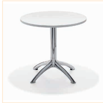
Tisch K4 weiß, ø 80 cm, EUR 64,-