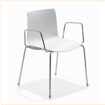
Stuhl CATIFA weiß mit Armlehnen, EUR 47,-